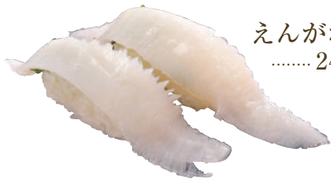
えんがわ ..... 240円