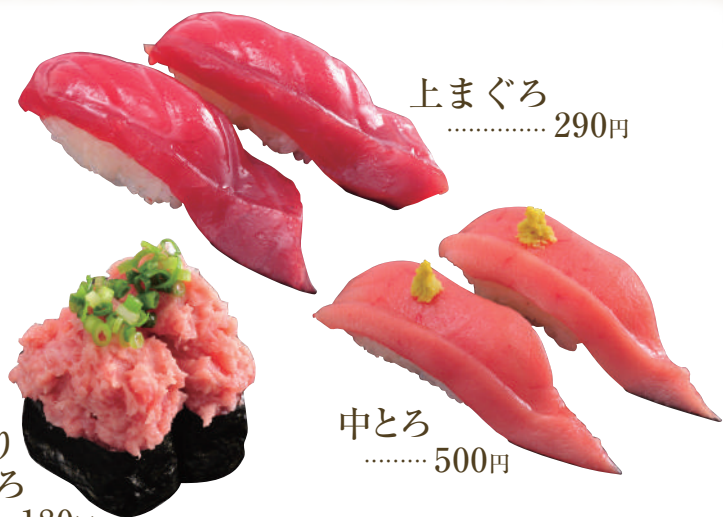
上まぐろ ..... 290円