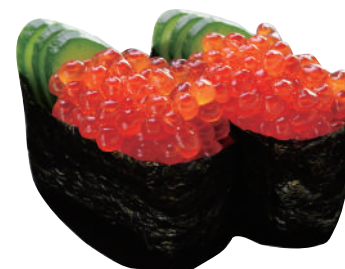
いくら ..... 290円