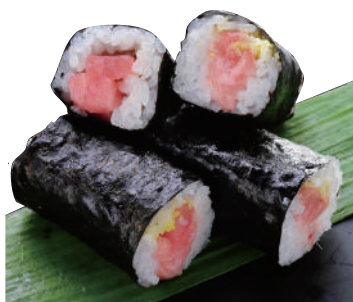
鉄火巻き ..... 180円