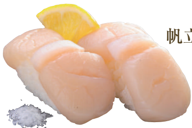
帆立貝柱塩レモン ..... 290円