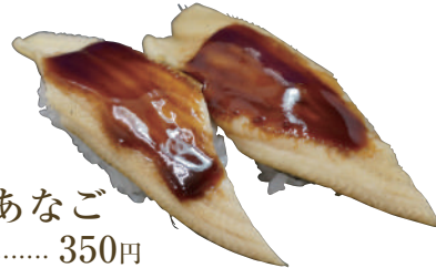
煮あなご ..... 350円