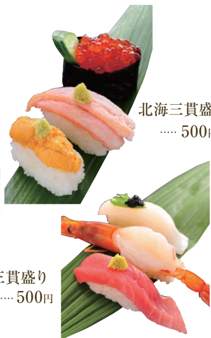
北海三貫盛り ..... 500円