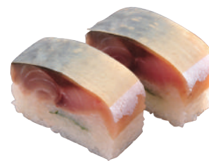
バッテラ ..... 240円