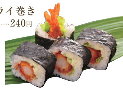
海老フライ巻き ..... 240円