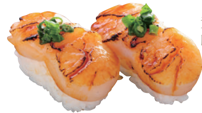
炙り 帆立貝柱甘だれ ..... 290円