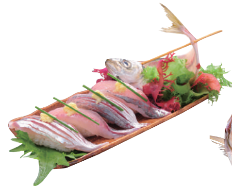
活あじの握り ..... 740円