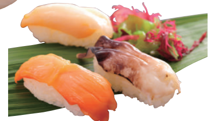
貝食べ比べ三貫盛り ..... 500円