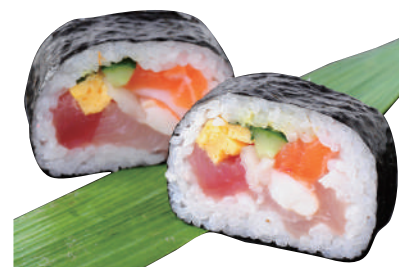
海鮮巻き寿司 ..... 240円