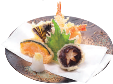
天ぷら 盛り合わせ ..... 680円 ※内容は季節により 写真と異なります