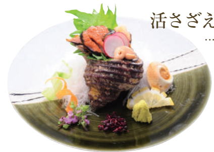
活さざえの刺身 ..... 400円

若鶏竜田揚げ ..... 290円 野菜のかき揚げ ..... 180円 フライドポテト ..... 180円 いか下足天ぷら ..... 180円