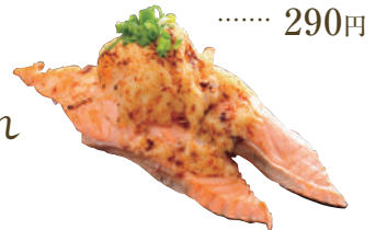
炙り 生海老甘だれ ..... 290円