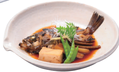
メバルの煮つけ ..... 850円