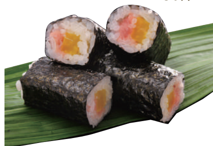
とろたく巻き ..... 180円