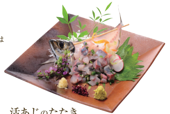
活あじのたたき ..... 740円