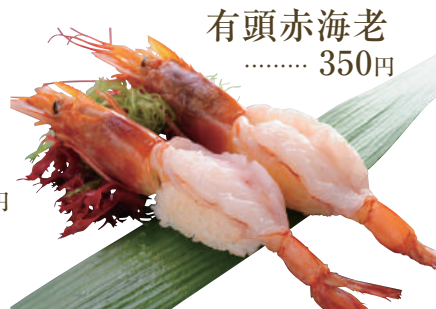
有頭赤海老 ..... 350円