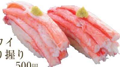
紅ズワイ 山盛り握り ..... 500円