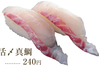
活メ真鯛 ..... 240円