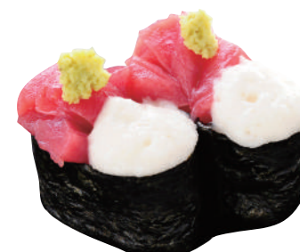
まぐろ山かけ ..... 180円