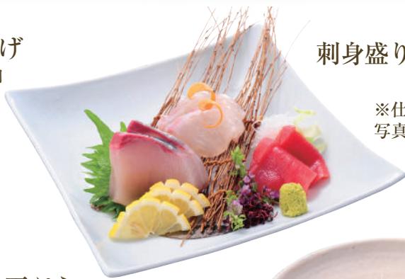
刺身盛り合わせ 三点 ..... 680円 ※仕入れによって内容は 写真と異なります