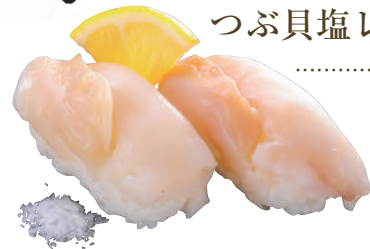
つぶ貝塩レモン ..... 240円