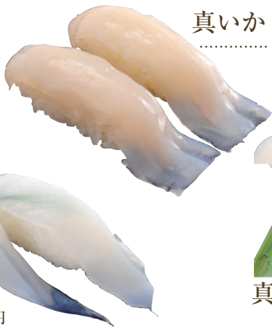
真いか ..... 180円