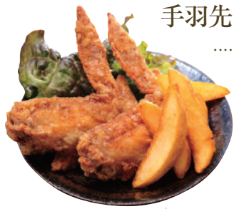
手羽先から揚げ ..... 240円