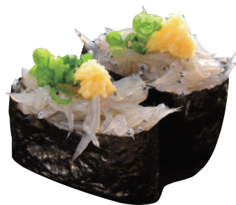
生しらす軍艦 ..... 240円