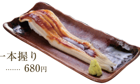
あなご一本握り ..... 680円