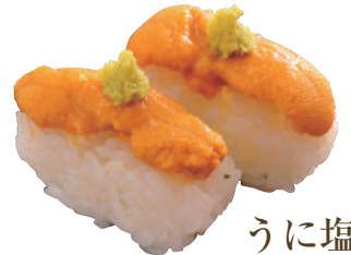
うに塩握り ..... 500円