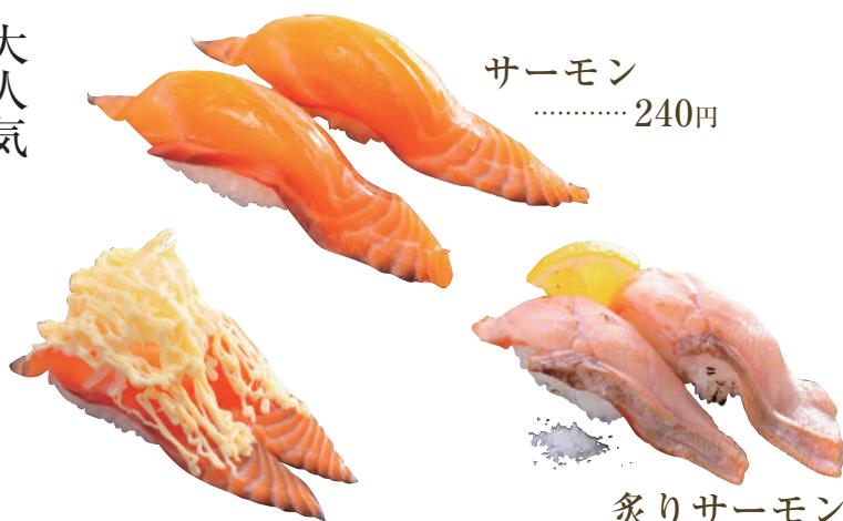
サーモン ..... 240円