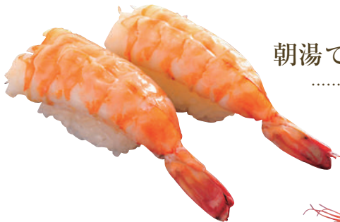
朝湯で海老 ..... 180円