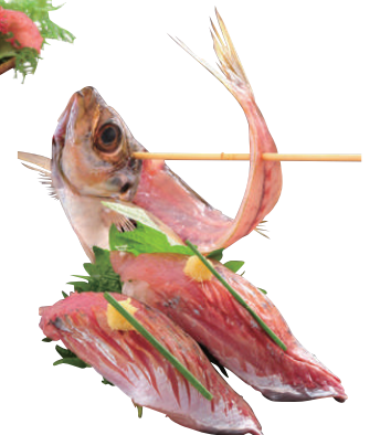
天然小あじ姿握り ..... 240円