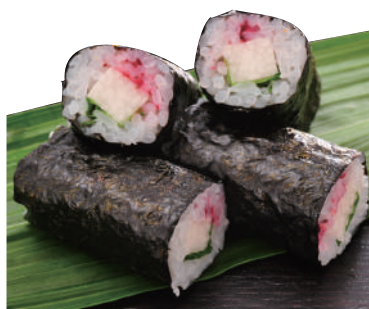
山芋梅肉巻き ..... 180円