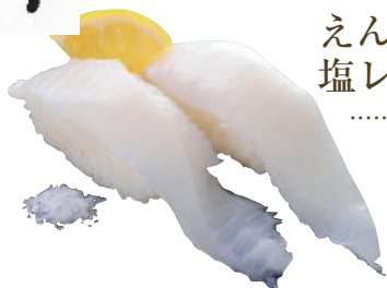
えんがわ 塩レモン ..... 240円