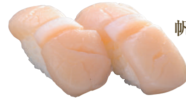
帆立貝柱 ..... 240円