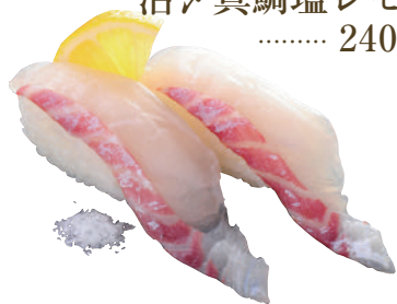
活メ真鯛塩レモン ..... 240円