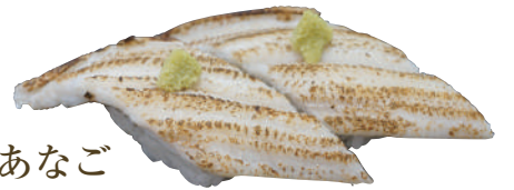
国産 白焼きあなご ..... 400円