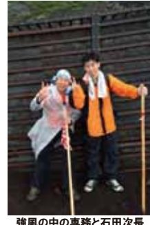
強風の中の専務と石田次長

参加者の皆さん、雨男の私を色々とお叱りかけ下さりありがとうございます。(また登ろうな。)