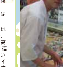
To be continued

私が鮮コーポレーションのアルキバイトからです。初めはキッチンでの作業倉庫炊きやエビ類の仕込みが中心でした。お客様と直接接する事は余りありませんが、その作業は、舎利も補を使い手作業で準備してました。作業が上手くなくなり自分のスタッフと時間を競うようになり、綺麗に仕上がるとう嬉しくなりました。そのうちレイン内で寿司を握る作業を指導して頂きました。その当時は授業中も消しゴムを使った練習など商品も自分で作る事に熱中してました。