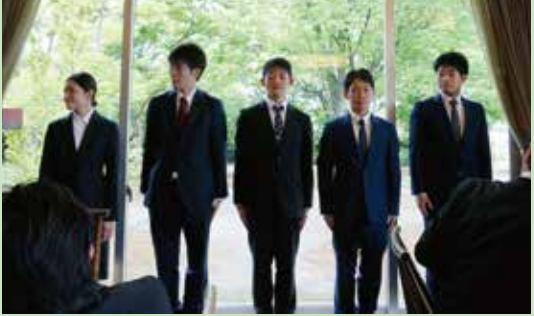
↑新入社員の堂々とした先導で【経営理念】の唱和が行われ、会がスタートしました