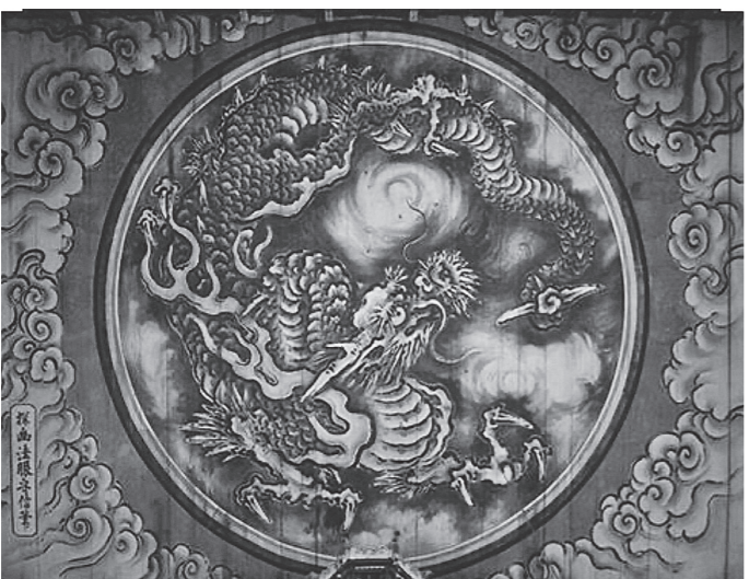
京都妙心寺の八方睨みの龍 まわしながら見て下さい。龍の目を。